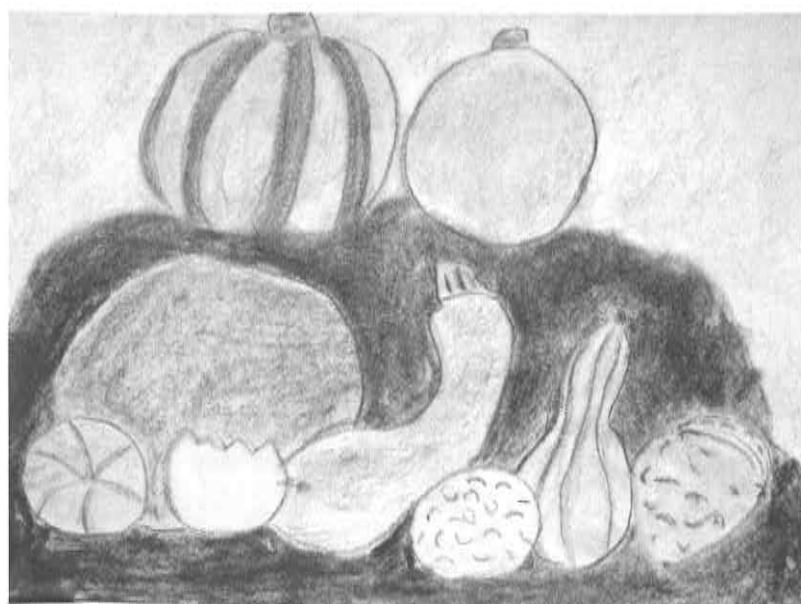
Katja Bezjak, 10 let