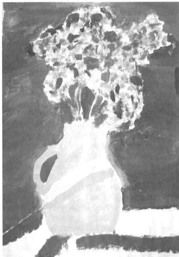
Teja Jurič, 10 let